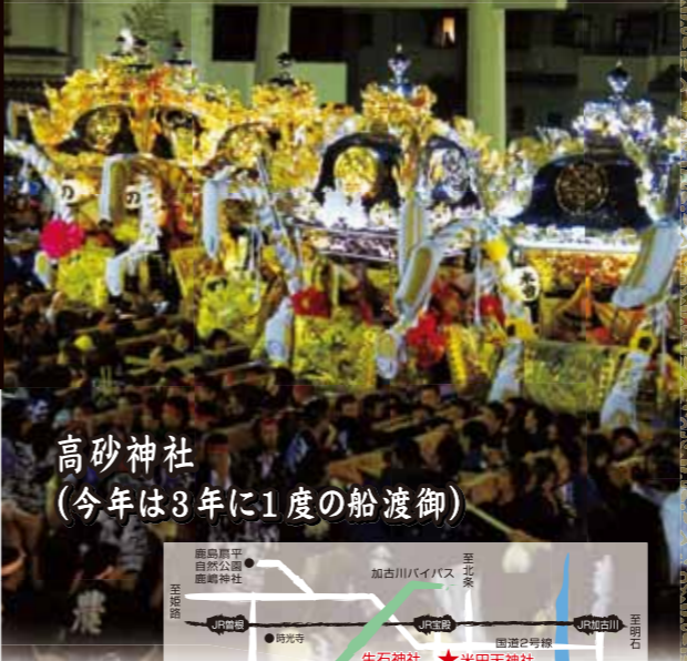
高砂神社 (今年は3年に1度の船渡御)